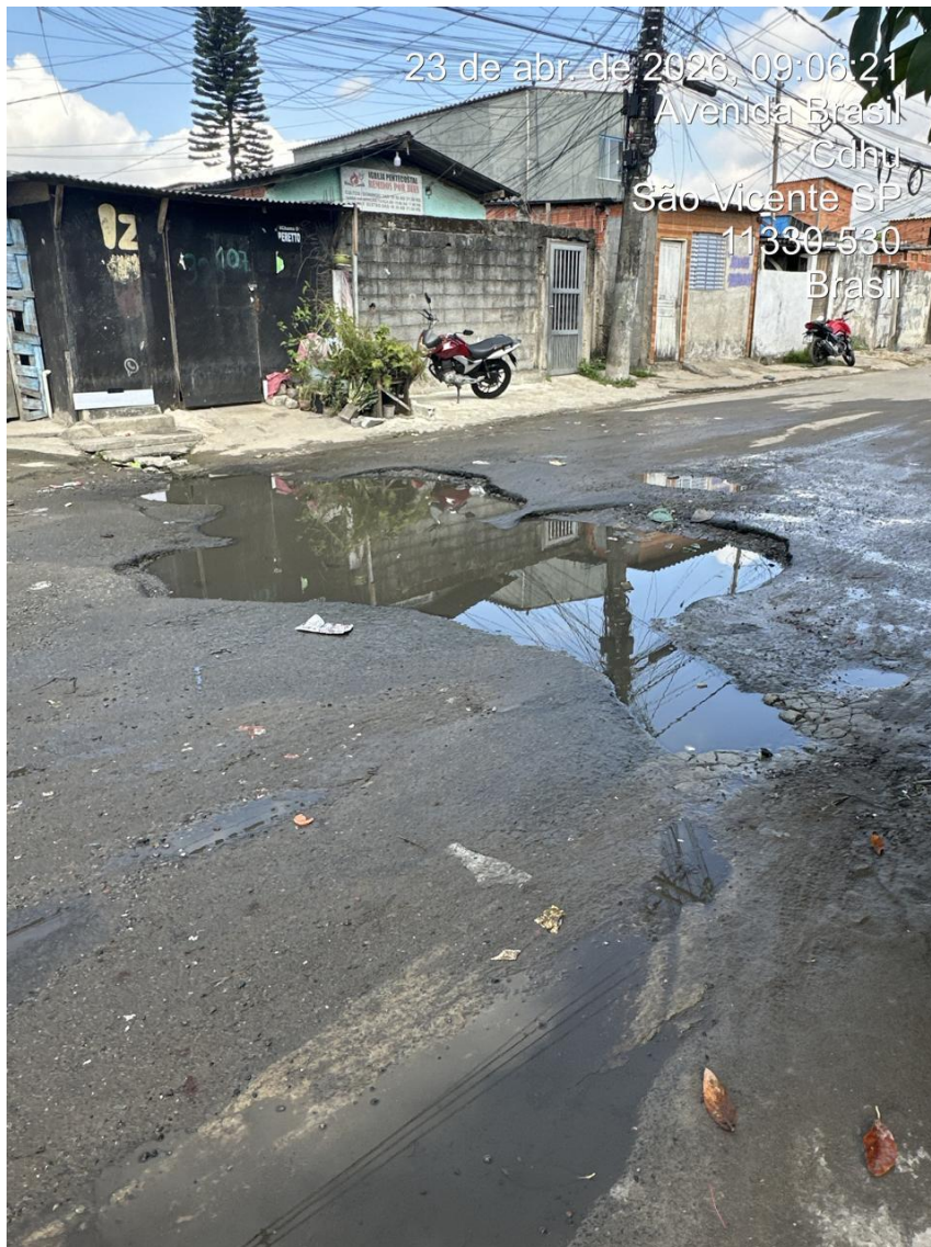
Serviço de Tapa Buracos, sito Av. Brasil, 323 - Vila Margarida.