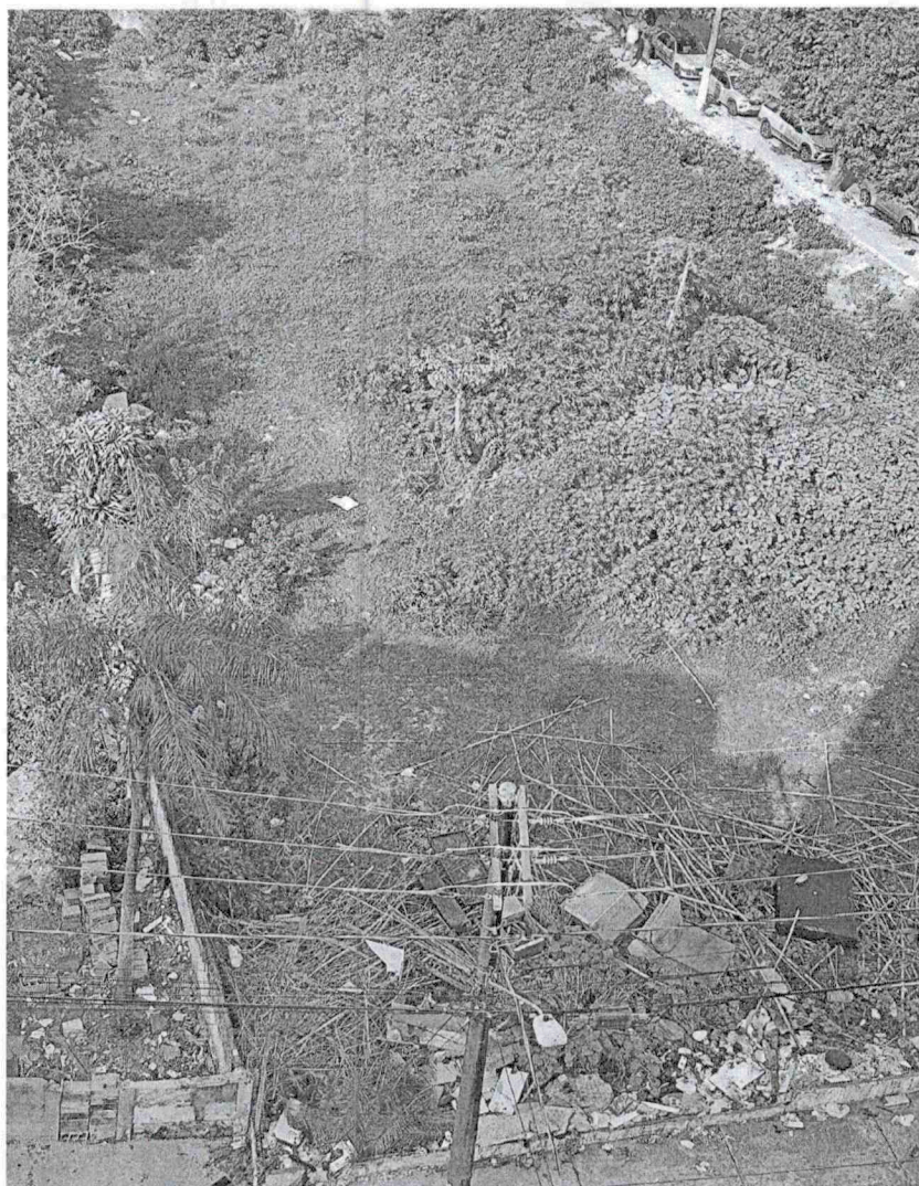
Imagem do terreno sito o cruzamento entre a Rua Cel. Silva Telles com Rua Guarani, no bairro Parque São Vicente.