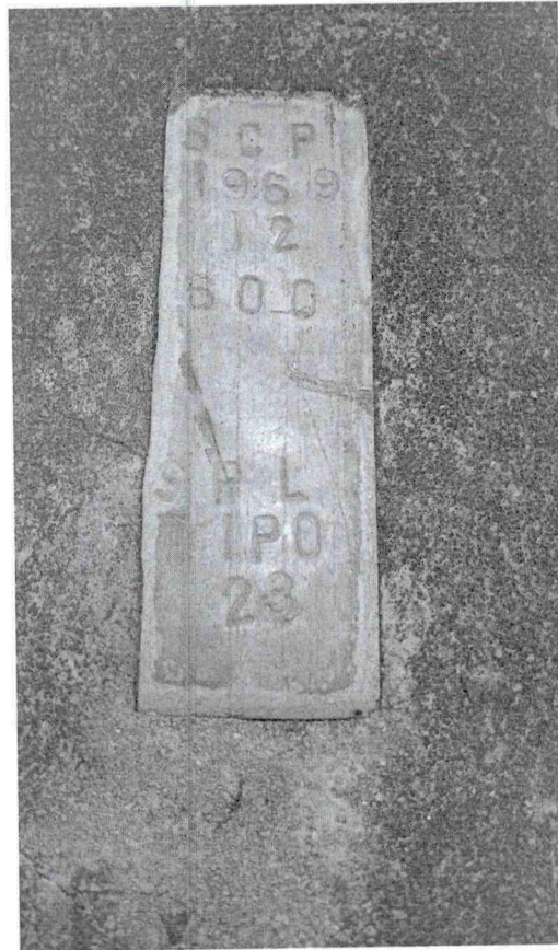
Imagem 2 - Identificação do poste