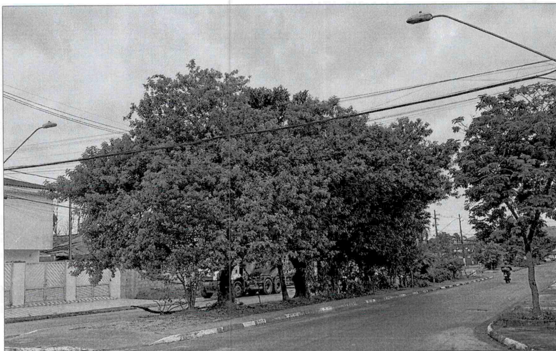
Serviço de corte e poda de árvore, sito a R. Tamoios, 357 - Parque São Vicente.