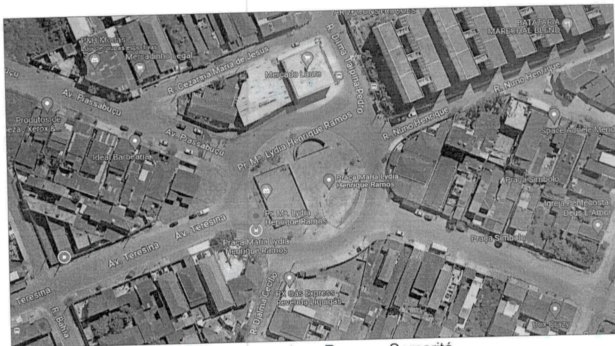
Praça Ma. Lydia Henrique Ramos - Samaritá